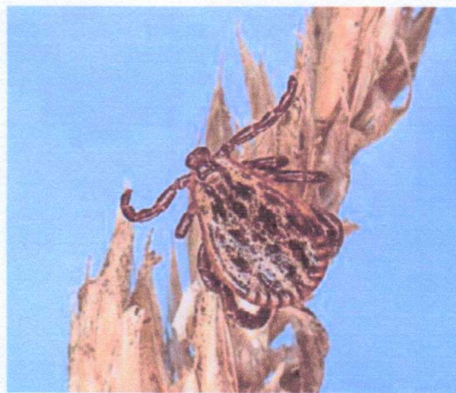
Una garrapata, adherida a una espiga de cereal.

Los expertos aconsejan utilizar unas pinzas, de punta estrecha, a ser posible curvadas. Servirán para sujetar la garrapata por su zona bu-