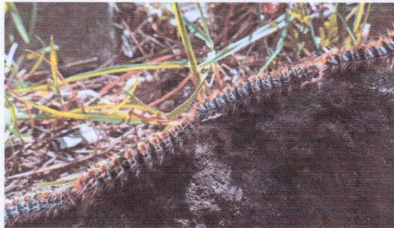
Detalle de una hilera de formación típica de la procesionaria del pino.

to tiene varios ciclos. Las mariposas o hembras adultas ponen los huevos en las agujas de los pinos. Las orugas tardan unos 30 o 40 días en nacer. Las larvas van construyendo nidos de seda en las ramas de los pinos. En su crecimiento atraviesan cinco fases precedidas de otras tantas mudas. El proceso se prolonga durante 4 o 5 meses. En la madurez descienden al suelo y, guiadas por una hembra, se dirigen en procesión para enterrarse. En el tercer estado se forman unos dardos urticantes.